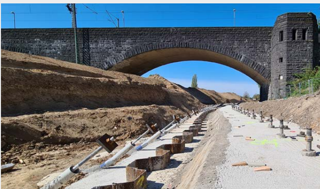
Für die Rückverankerung der Spundwand und die Gründung der Deichmauer wurden Mikropfähle TITAN eingesetzt.

180 Bohrmeter pro Tag problemlos aufrechterhalten werden.“ Die bis zu 12 Meter langen Mikropfähle TITAN wurden in vor Ort gekoppelten 3 Meter-Schüssen abgebohrt, so dass die beengten Platzverhältnisse keine Einschränkung darstellten. Der „selbstbohrende“ Mikropfahl TITAN sorgte für einen schnellen und zugleich wirtschaftlichen Baufortschritt. Auf zusätzliche Arbeitsschritte, wie z.B. das Einbringen und Ziehen einer Verrohrung zur Bohrlochstabilisierung oder auf das Nachverpressen zur bereichsweisen Verbundverbesserung, konnte aufgrund des gewählten Verfahrens verzichtet werden. Mikropfähle TITAN sind mit der allgemeinen bauaufsichtlichen Zulassung / allgemeinen Bauartgenehmigung Z-34.14-209 vom DIBt zugelassen und dürfen für dauerhafte Anwendungen von 100+ Jahren eingesetzt werden. Es wird also einige Zeit in Anspruch nehmen, bevor der neue Deich wieder in die Jahre kommt.