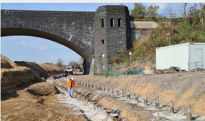
Trotz der beschränkten Höhe unterhalb der Brücke konnte die Bohrleistung problemlos aufrechterhalten werden.